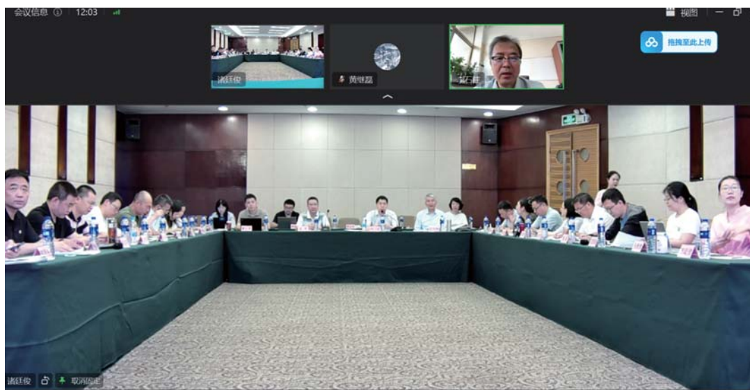
《华支睾吸虫病防治技术方案》与《土源性线虫病防治技术方案》编制工作会