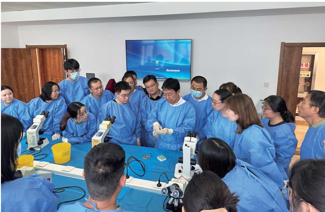
华支睾吸虫中间宿主调查和监测技术培训班暨全国肝吸虫病和土源性线虫病监测技术培训班