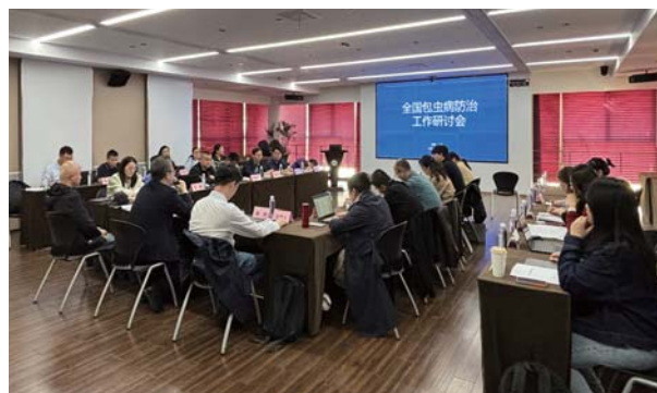
全国包虫病防治工作研讨会