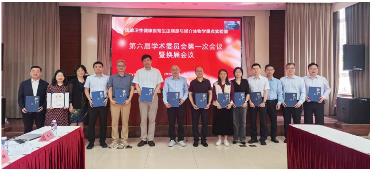
国家卫健委寄生虫病原与媒介生物学重点实验室学术委员会第六届一次会议