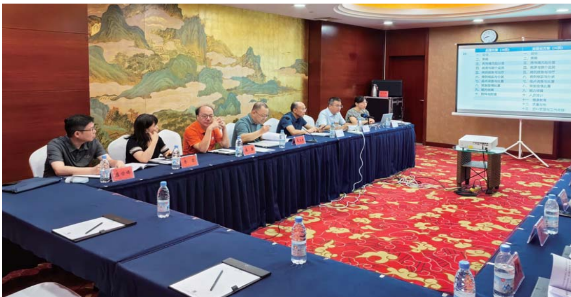
消除疟疾后防止输入再传播技术方案修订研讨会