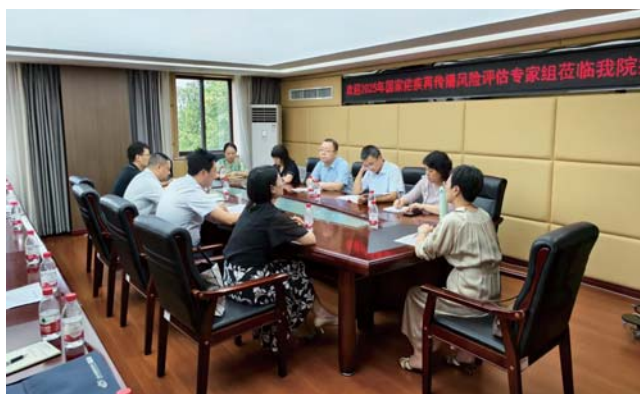
疟疾再传播风险评估