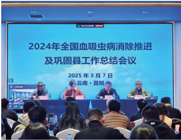
全国血吸虫病消除推进及巩固县工作会议