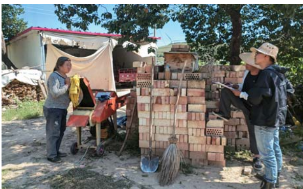
包虫病传播风险评估现场工作