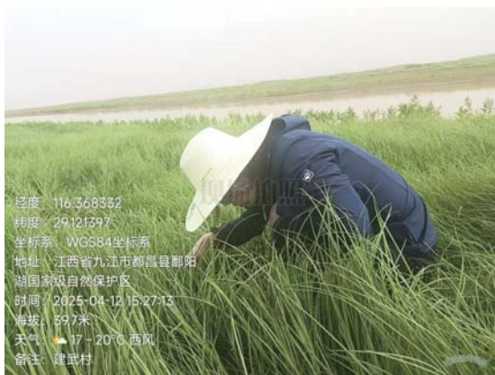
7省开展暗访及风险评估工作