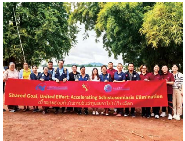
血吸虫病监测技术示范研讨会