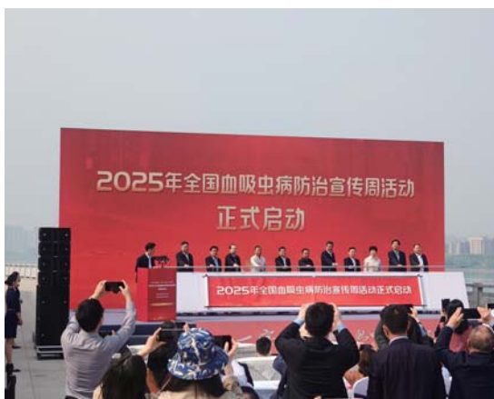
2025年全国血吸虫病防治宣传周系列活动