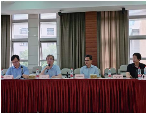
2025年血吸虫病监测与检测技术国际培训班