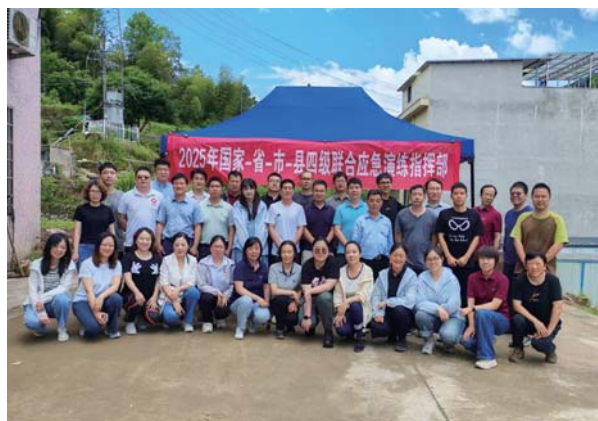
重大灾害后疫情风险评估培训及现场调查演练