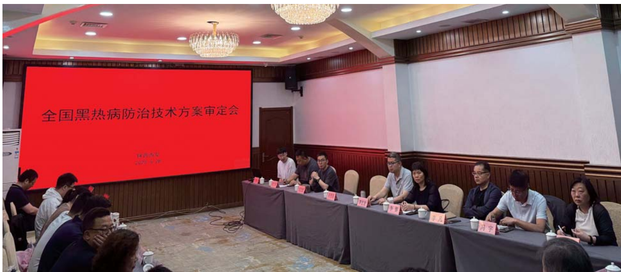
黑热病防治技术方案审定会