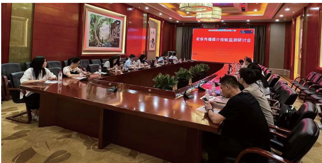
疟疾传播媒介按蚊监测研讨会