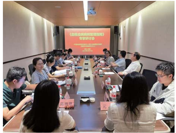
《血吸虫病病例管理指南》专家研讨会