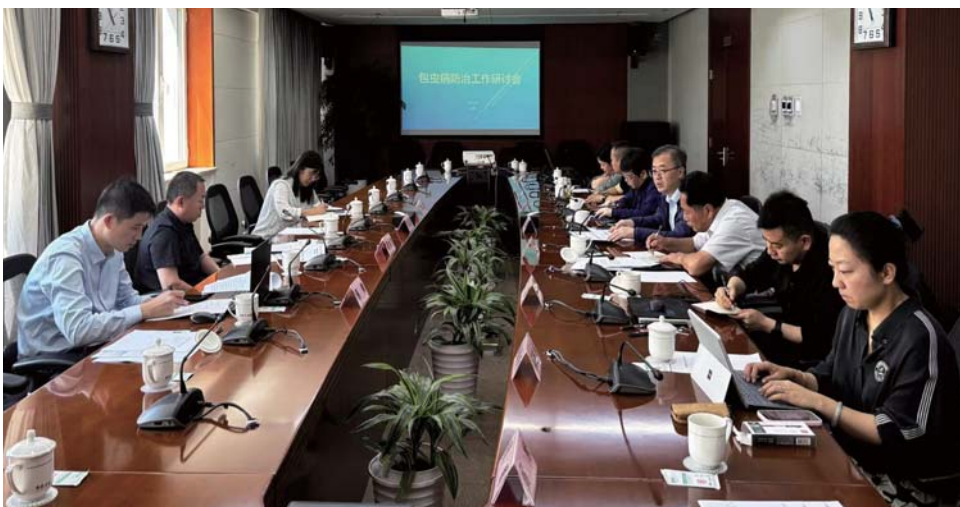
参加疾控局包虫病研讨会