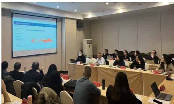
包虫病室专家赴新疆乌鲁木齐推进局 委托包虫病信息化建设项目