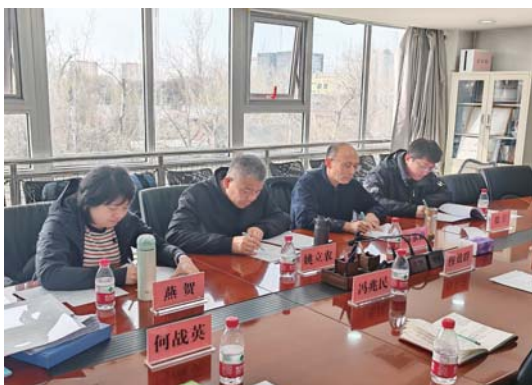
北京市级疟疾诊断参比实验室评审