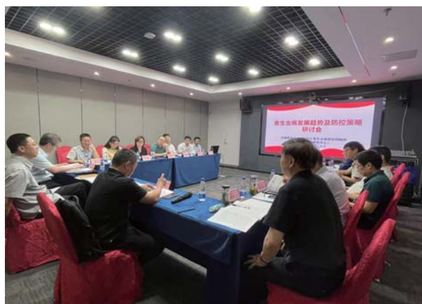
寄生虫病发展趋势及防控策略研讨会