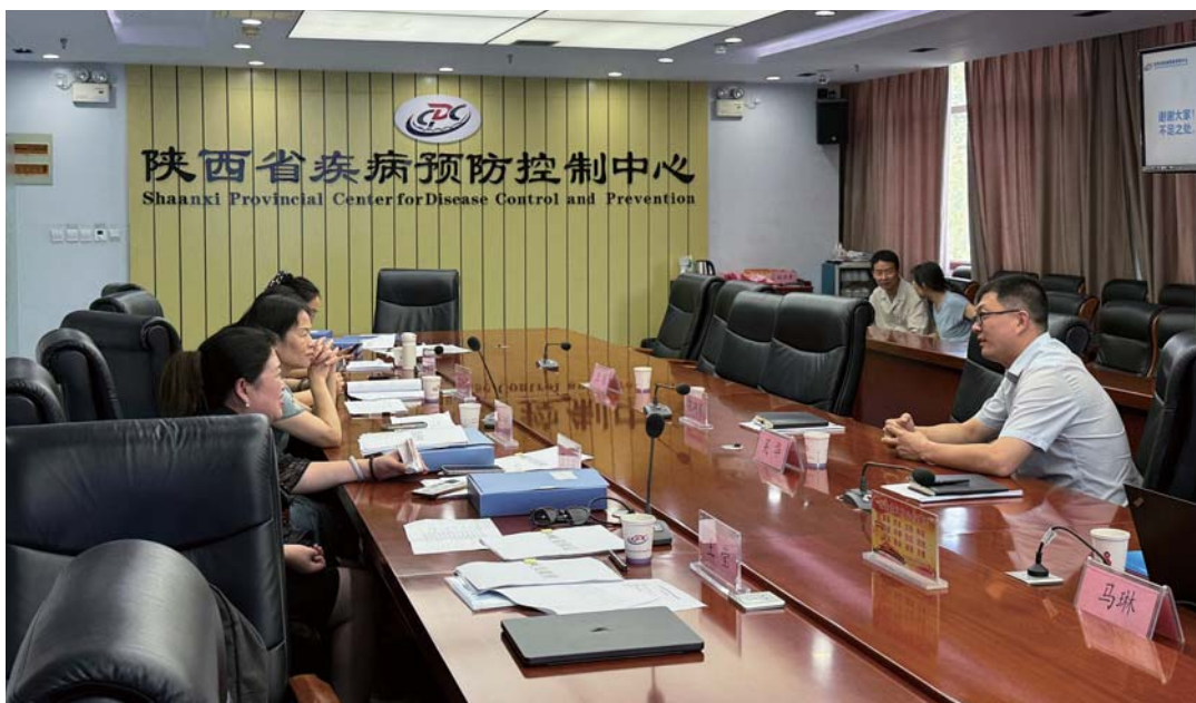
包虫陕西参比实验室