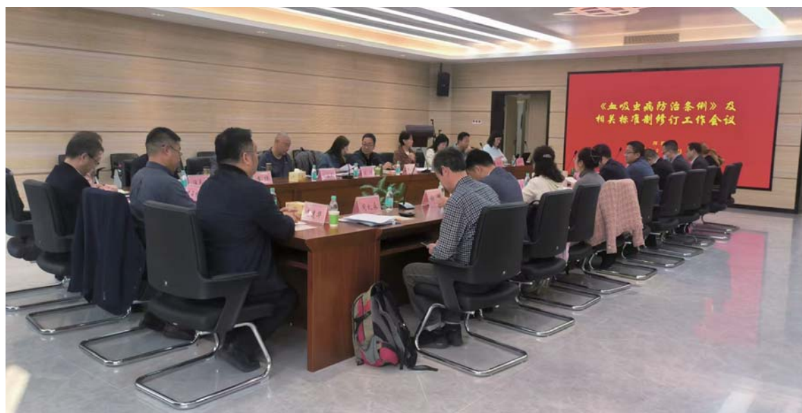
《血吸虫病防治条例》及相关标准制修订工作会议