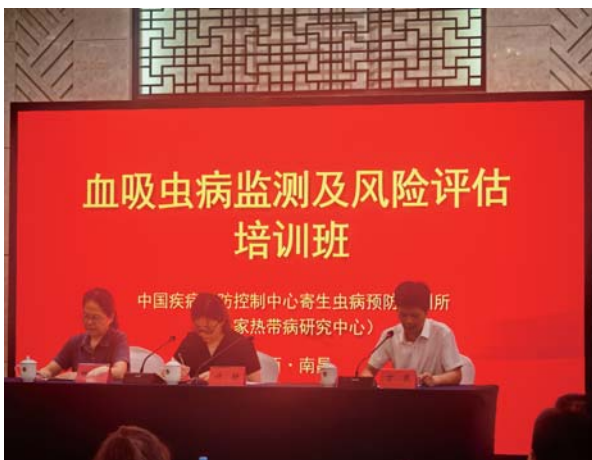
血吸虫病监测及风险评估培训班