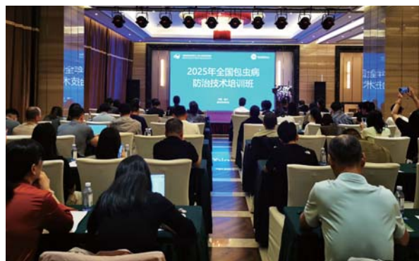
全国包虫病防治技术培训班在宁夏举办