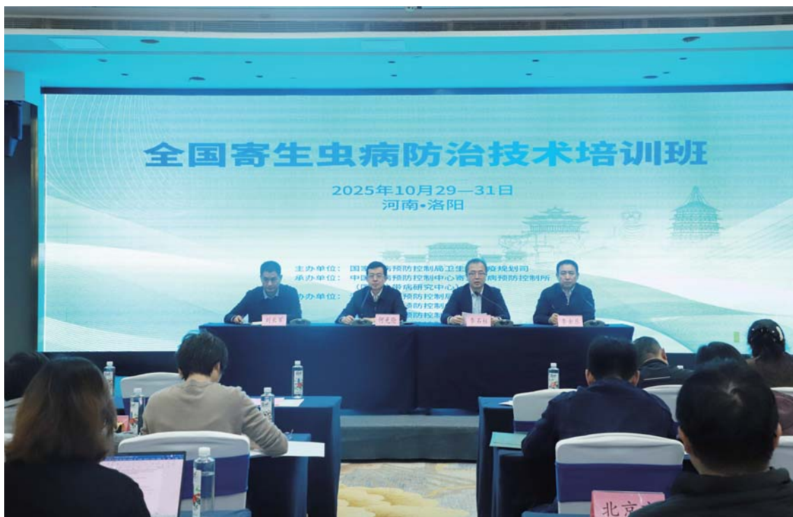
全国寄生虫病防治技术培训班