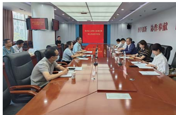
陕西西安参比实验室评审