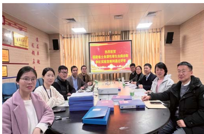
福建省参比实验室评审