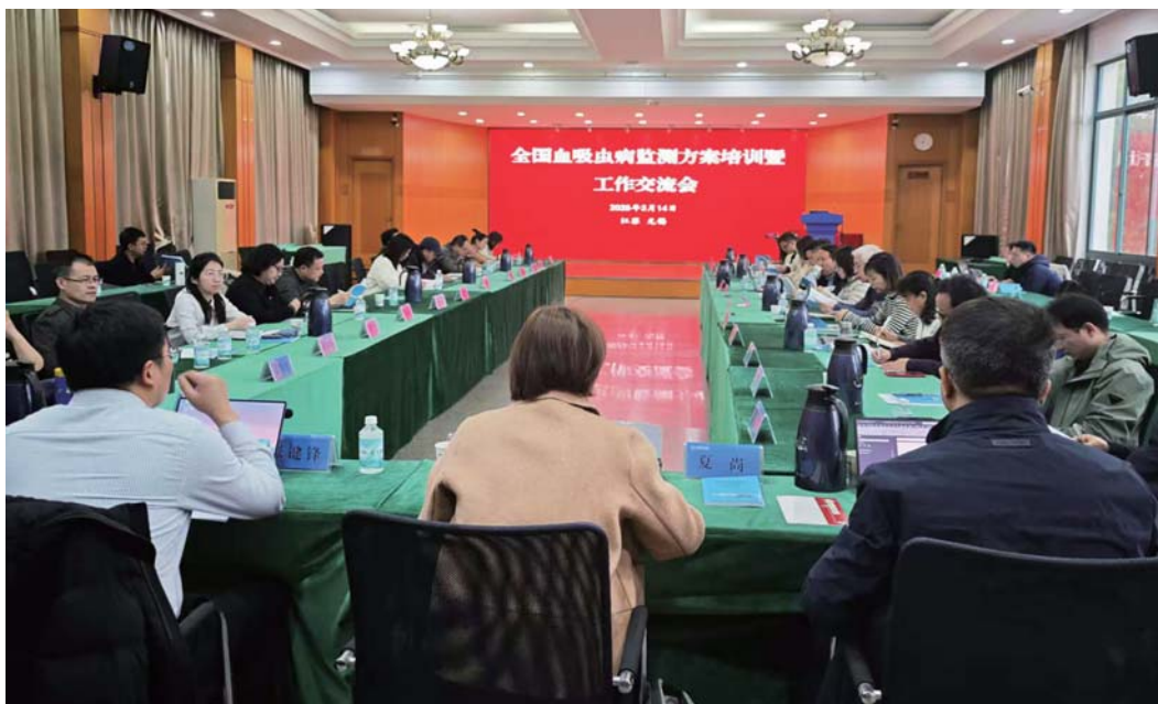
2025年全国血吸虫病防治年报工作会议