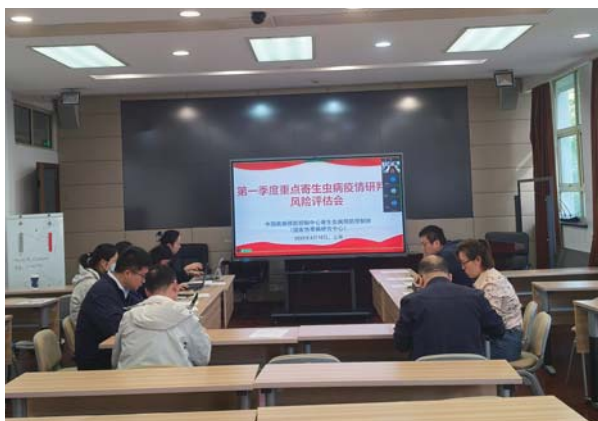
重点寄生虫病疫情研判和风险评估会