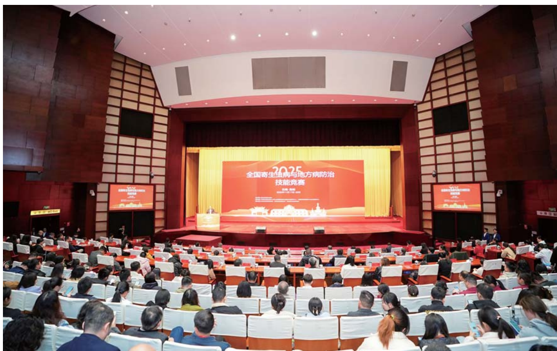
全国寄生虫病防治竞赛