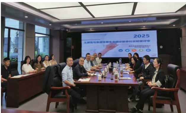
重庆市参比实验室评审