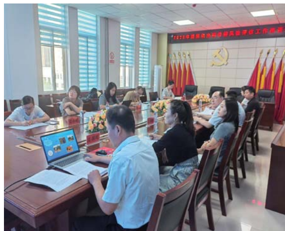
《华支睾吸虫病防治技术方案》和 《土源性线虫病防治技术方案》