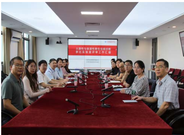
天津市参比实验室评审