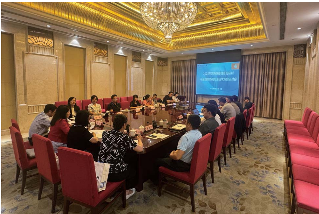
黑热病疫情形势研判和全国黑热病防治技术方案研讨会