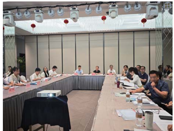
全国血吸虫病消除工作研讨会