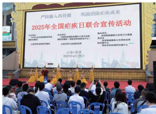
全国边境地区疟疾日现场联合宣传活动