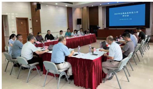
媒传热带病及其媒介生物监测技术研讨班