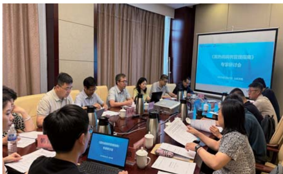
《黑热病例管理指南》专家研讨会