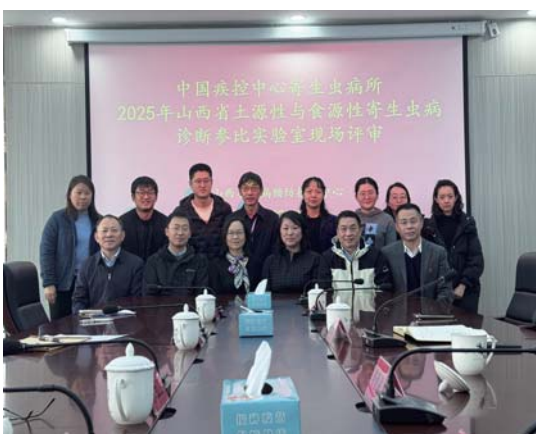
山西太原参比实验室评审